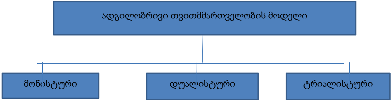
ნახ. 3. ადგილობრივი თვითმმართველობის მოდელი პირველადი კომპეტენციის ორგანოთა რაოდენობის მიხედვით

ქვეყანათა უმრავლესობის ადგილობრივი თვითმმართველობის სიტემებისათვის დამახასიათებელია ადგილობრივი ხელისუფლების ორ ელემენტად გაყოფა, ესაა: წარმომადგენლობითი და აღმასრულებელი ორგანო.